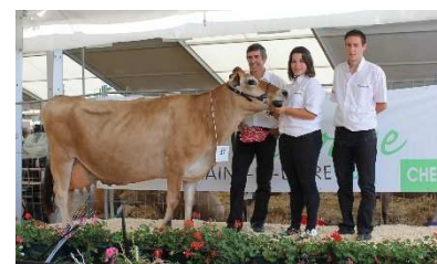
Artiste : Prix de longévité, en 9 ème L°

Cette vache a produit 882 kg de MU en 5 ème lactation brute soit 7360 kg à 65,5 TB et 44,4 TP, le tout en étant pointée TB 86 ! Le prix de Longévité revient à Artiste, en 9 ème lactation du Gaec de la Jutière. Bravo à tous !