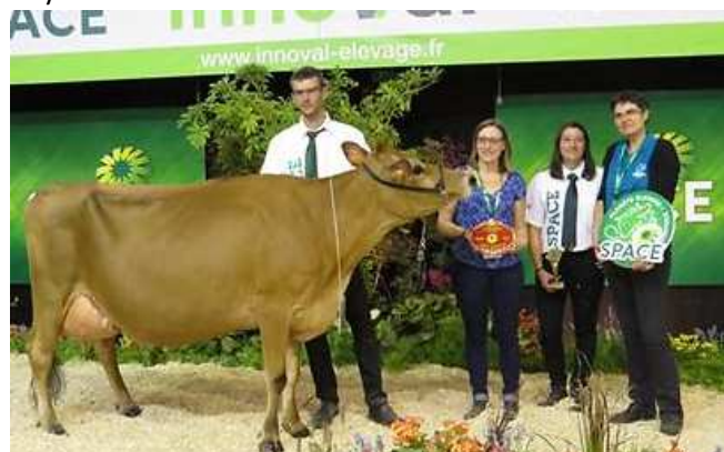
Grande Championne Hulsa (VJ Huls) du GAEC FERME JERS HYS

représentent bien la demande du marché en femelles Jersiaises. Notre partenaire danois VikingGenetics a d'ailleurs consacré un large article sur son site à cette vente incroyable.