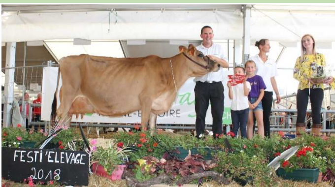
FLASH 1ère 6L° et +, MM Adulte, Ch. Adulte, Grande Championne

Chemillé, la référence des concours départementaux en France accueillait cette année 33 vaches jersiaises sur les 600 animaux en concours. Et pour mettre en avant sa longévité, les 11 élevages présents ont choisi de montrer au public 2 sections de vaches adultes : des vaches en 6 ème , 8 ème et même 9 ème lactation !