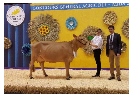
Jutière (DJ HOLMER)

1 JUTIERE (DJ Holmer) GAEC DE LA JUTIERE 49 2 IMBATTABLE (DJ Aly) SCEA GABORIT 49 3 HARMONICA (DJ Zaga) EARL DU MORTIER 49