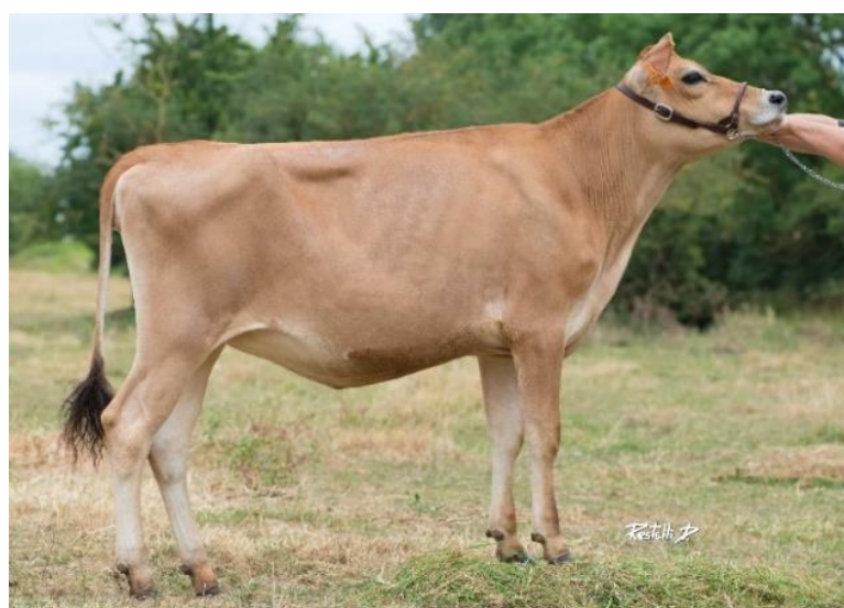
Lonesse (DJ ZUMA), NM 388, vendue à la vente Genomic Elite du SPACE 2016

Contactez Jersiaise France pour manifester votre souhait de génotyper vos femelles. Jersiaise France se charge ensuite d'organiser le prélèvement et de vous restituer les résultats après analyse aux USA.